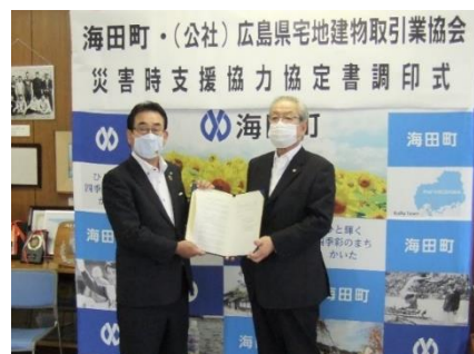
海田町長と津村会長