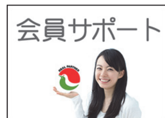
↑このバナーが目印です