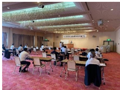
相談員研修会の様子