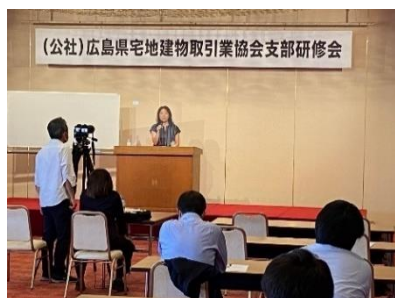
演台で解説する高川先生