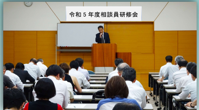
研修会の様子(広島会場)